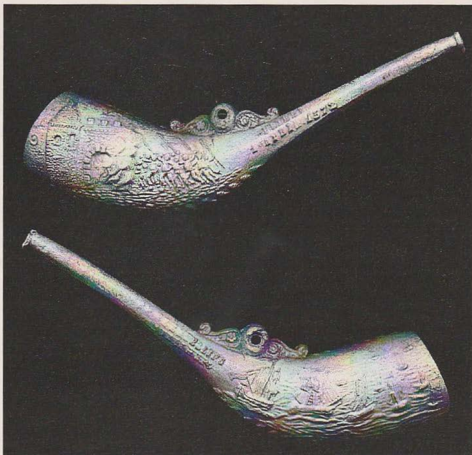
Afbeelding 2: 1a. Collectie Louis Bracco Gartner; 1b. - ; 2a. Hoorn; 2b. Stadspoort Den Briel met watergeuzen / Watergeuzen vloot; Kijkglasje tussen 2 bloemconsoles; 2c. -/-; 2d. -; 2e. Ongeglasd; 2f. Gebotterd; 2g. Geen radering rondom ketelopening; 2h -; 3a. " BRIELLE 1 APRIL 1572" / "300 JARIG BESTAAN VAN NEERLANDS VRIJHEID"; 3b. ongeglasd; 3c. -; 4. 1872; 5. Gouda; 6. -; 7. Duco, D.H., (1992). De Tabakspijp als Oranjepropaganda. Leiden. p.68.

Afbeelding 2 is een fraaie pijp met een hoornvormig model. Op de linkerzijde van deze pijp staat de stadspoort van Brielle. De toren is in brand gestoken door de watergeuzen die daar stonden te wachten om naar binnen te kunnen. Op de rechterzijde zien we de vloot van de watergeuzen. Boven op de pijp zit tussen twee bloemconsoles een kijkglasje waarop we, als we deze tegen het licht houden, een minuscule prent zien waarop we eveneens de poort van Brielle in de brand zien staan. Voor deze poort staan wachtende en bewapende watergeuzen. Op de voorstelling in het kijkglasje lezen we in de bovenrand de tekst "OP DEN EERSTEN DAG VAN APRIL 1572 VERLOOR DUC D'ALVA ZIJN BRIL" De tekst op de steel van de pijp luidt links "BRIELLE 1 APRIL 1572" en op de rechterzijde is het niet goed leesbaar, maar daar heeft gestaan "300 JARIG BESTAAN VAN NEERLANDS VRIJHEID".