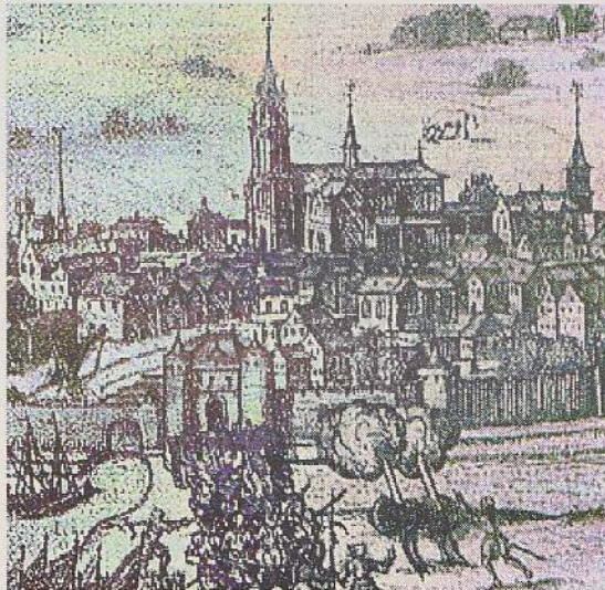
Afbeelding 1: Bevrijding van Brielle door de watergeuzen

Op 1 april 1872 werd de 300-jarige overwinning op de Spanjaarden bij Brielle (Den Briel) herdacht. Vele Goudse pijpenmakers grepen dit moment aan om over dit onderwerp pijpen uit te brengen. In dit artikel wil ik bij vier van deze pijpen de overeenkomsten en de verschillen laten zien en deze in de volgorde van de gebeurtenis plaatsen.