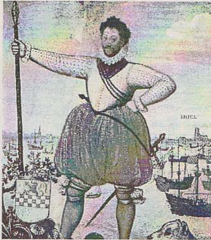
Afbeelding 6: Admiraal Lumey leider van de Watergeuzen

Toen de watergeuzen zowel bij de Noord- als de Zuidpoort binnenvielen namen ze de stad over, streken de Spaanse vlag en hezen de prinsenvlag van Oranje.