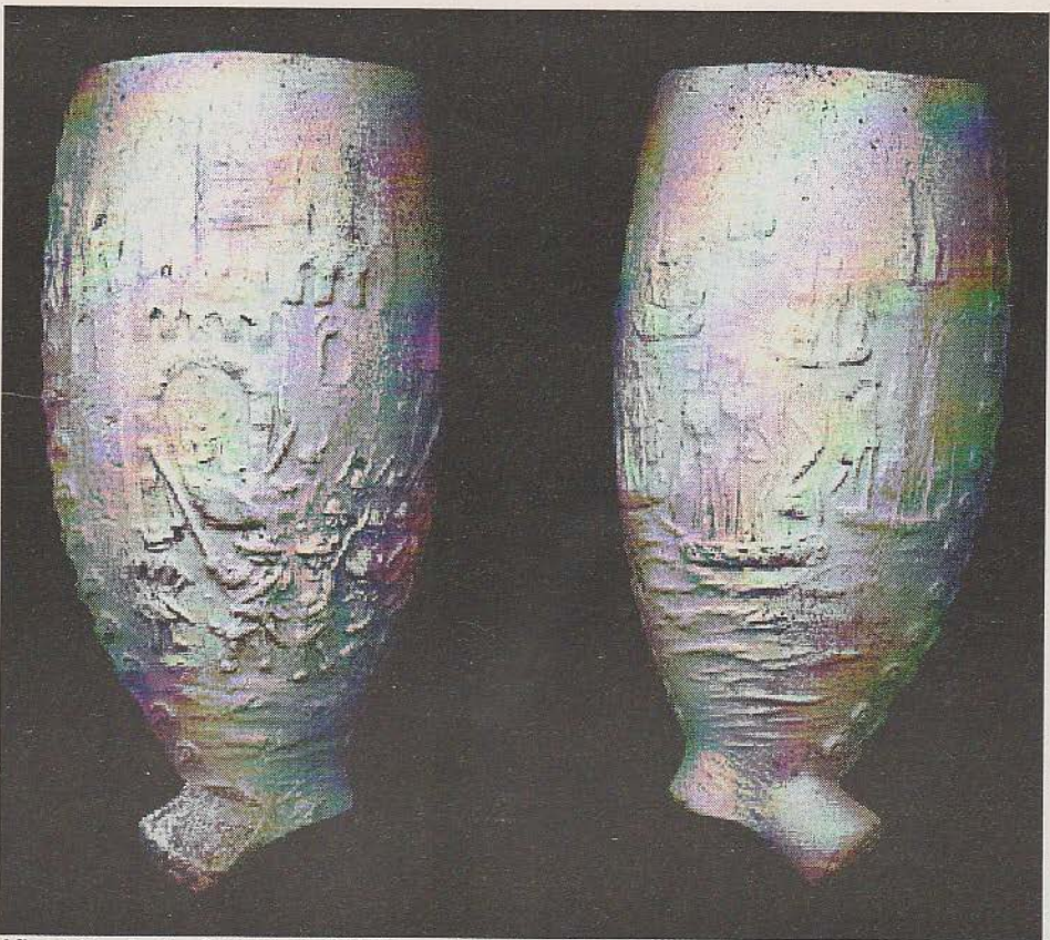
Afbeelding 4: 1a. Collectie Aad Kleijweg; 1b. Achterwillens, Gouda ; 2a. Ovoïde; 2b. Stadspoort Den Briel met watergeuzen / watergeuzen vloot; 2c. -/-; 2d. 65 gekroond; 2e. Ongeglaasd; 2f. Gebotterd; 2g. Geen radering rondom ketelopening; 2h -; 3a. ; 3b. ; 3c. -; 4. 1872; 5. Gouda; 6. Adrianus van Duijn; 7. Stam, R., en F. Mayenburg. 1990. Een stort van Adrianus van Duijn. In: Pijpelogische Kring Nederland, 13 e jaargang, nummer 50, p. 228-229.

Afbeelding 4 is een ovoïde pijp welke met hetzelfde thema is versierd. We zien links de stadspoort van Brielle met hiervoor watergeuzen met wapens en vaandels die de stad belegeren. Op de rechterzijde zien we weer een aantal schepen van de watergeuzenvloot op de Maas. De tekst die op de ontbrekende steel gestaan heeft luidde "BRIELLE 1 APRIL 1572" / ".... 3E EEUWFEEST".